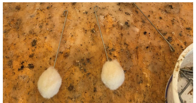
Cov paj rwb ntsaws