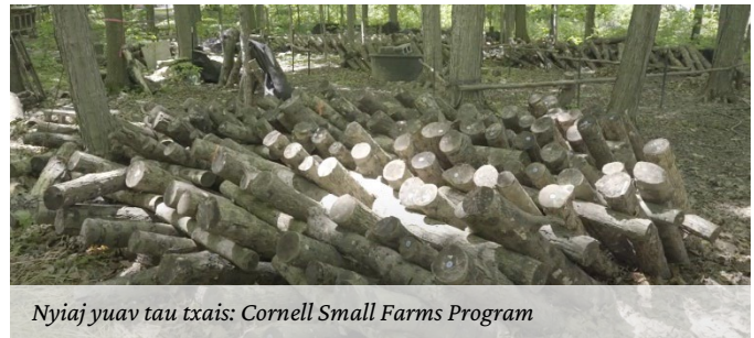
Nyiaj yuav tau txais: Cornell Small Farms Program