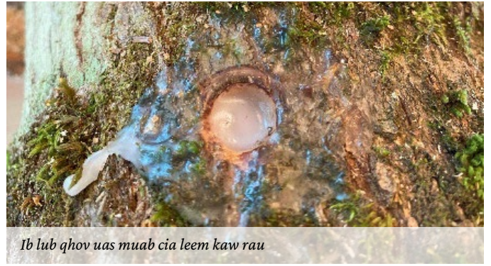
Ib lub qhov uas muab cia leem kaw rau

Muab rab rauj los maj mam npuj pob hmoov ntoo ntsaws mus rau txhua lub qhov. Yuav tsum tsij txhua pob hmoov ntoo ntsaws rau hauv txhua lub qhov kom tag. Yog hais tias ib feem ntawm pob hmoov ntoo ntsaws yog tshoom tawm los siab tshaj npoo qhov ntawm yav cav ntoo, ces tej zaum yog lub qhov tob tsis txaus.