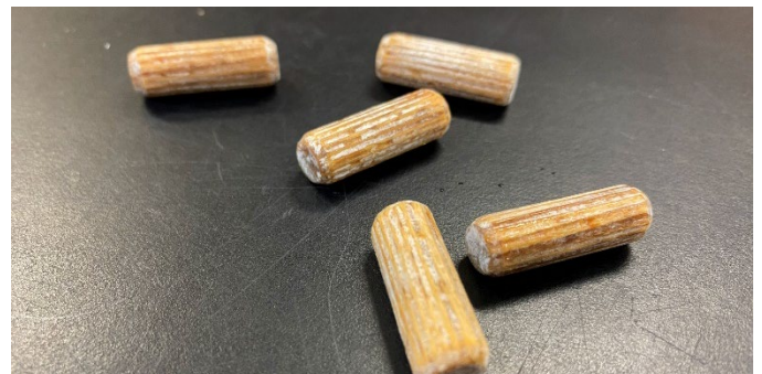
Pob hmoov ntoo ntsaws